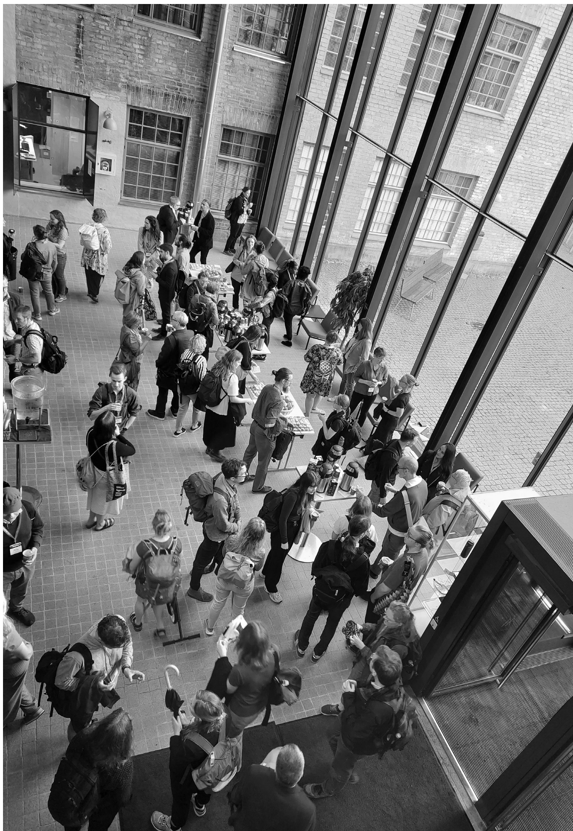
NESS-konferensdeltagare vid Åbo Akademi juni 2024.