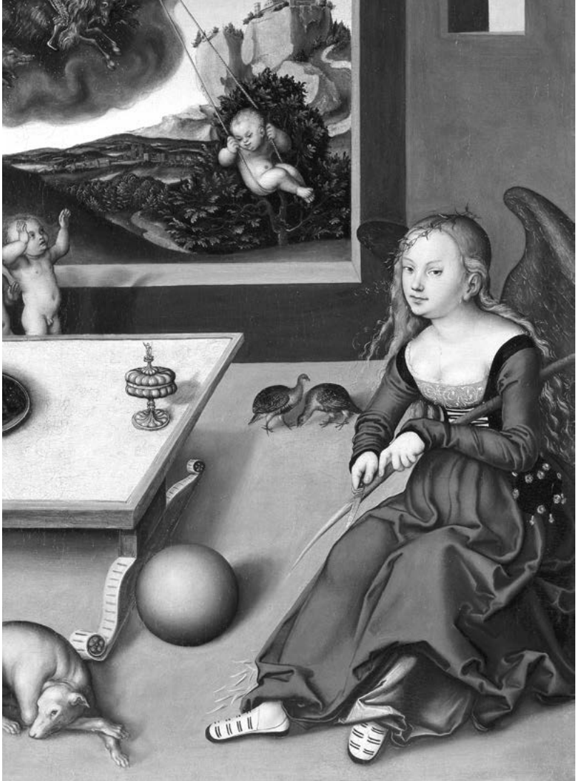
Lucas Cranach vanhemman (1472–1553) öljymaalauk Die Melancholie vuodelta 1532. Musée d'Unterlinden. Wikimedia Commons.