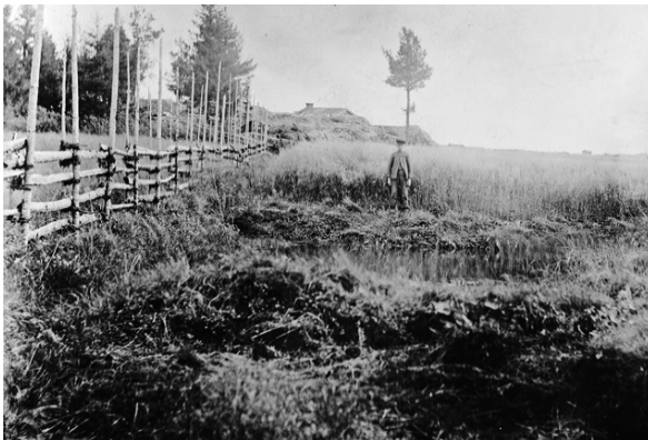
Kuva 2. Alfred Hackmanin v. 1894 ottama kuva Levänluhdasta.

Tieteellisesti ja suurelle yleisöllekin poikkeuksellisen kiinnostavaksi Levänluhdan löydön tekevät mm. löytöpaikka, paikalle haudatut tai jätetyt ihmis- ja eläinluut, luiden perusteella arvioitu ihmisten määrä ja jäänteiden sukupuolijakauma, hautaustapa, aikakausi ja paikan pitkä käyttöaika ihmisten hautaamiseen. Paikan mystisyyttä on lisännyt keväällä lähteestä tuleva rautapitoinen, punertava vesi ja löytyneiden luiden tumma väri.