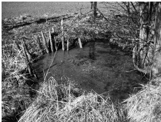
Kuva 3. Mikael Nyholmin v. 2012 ottama kuva Levänluhdasta. Museovirasto, Arkeologian kuvakokoelma, Inventaarionro AKDG2665:2.

Selitykset Levänluhdan löydöksen luonteesta ovat muuttuneet alkuperäisestä rikospaikasta ja Nuijasodan aikaisesta haudasta (Rancken 1886) uhri- tai teloituspaikaksi (Formisto 1993), sitä on pidetty vuosien 1808–1809 sodan venäläisten sotilaiden hautana (Haavio 1937) ja orjien tai köyhien hautausmaana (Meinander 1950) sekä myös Justinianuksen