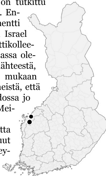
Kuva 1. Levänluhdan (alempi) ja Kälämäen (ylempi) sijainti Etelä-Pohjanmaalla.

Tämän jälkeen kuluu 200 vuotta ennen kuin Levänluhdan ihmisperäiset luut löydetään uudelleen niityn ojituksen yhteydessä. Paikkaa epäiltiin jonkin aikaa rikospaikaksi ja Isonkyrön nimismiehen johdolla luut haudataan takaisin löytöpaikkaansa. Vuon-