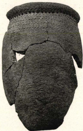
Fig. 4. Lerkärl. Jomala, Jettböle. \frac{1}{2} .

land. 1 Men mönstret ifråga har en långt vidsträcktare utbredning. Vi finner det i den italienska Molfettakeramiken 2 , i Böhmen 3 men också i yttersta Östern i Manchukuo 4 och Kina. 5 Har det över hela detta område ett gemensamt ursprung? Det hör knappast in i detta sammanhang, att diskutera de vägar på vilka det kan ha vandrat in till de åländska och östsvenska boplatserna, om från öster eller söder. Den östsvenska boplatserkeramiken vid denna tid har helt visst mottagit impulser från båda hållen. Kanske är det riktigt att motivet i varje fall har som Ailio förutskickat ett sydligt påbrå. 6