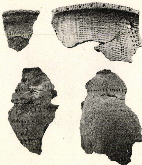
Fig. 2. Keramik från Golden Cove basin, New Haven.

kontinenterna 1 i förkolumbisk tid? O. Sirén 2 pekar — utan att anse sig kunna lösa frågan om i vad mån kontakt funnits mellan de båda världarna — på en slående likhet mellan de kinesiska t'ao t'ie från Yinperioden, c:a 1.000 f.Kr. och demoner på monument i Guatemala, Honduras och södra Mexiko.