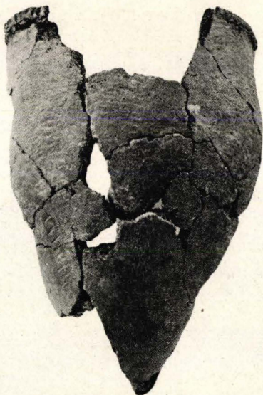
Fig. 3. Algonkiankärl från Whaleback shell mound, Damariscotta, Maine. 1

sig från en »shellheap» vid Kimball's Island och fig. 2 från Golden Cove basin, New Haven. Denna keramik tillhör algonkiantypen enligt Holmes terminologi. Sicksackmotivet är som synes företrätt i rik variation. Av särskilt intresse har jag tyckt det vara att här avbilda sida vid sida algonkiankärlet från Maine, fig. 3 och det för oss välbekanta lilla vackra kärlet från Jettböleboplatsen på Åland, fig. 4. På dessa kärl är motivet utfört i heldragna streck, men också till de med kamstämpelstreck utförda motiven i fig. 2 finns som bekant en åländsk motsvarighet. 2 Ornamentet ifråga förekommer enligt Ailio ofta på det östfinska keramiska området och fram till Sibirien, men däremot icke i västra Finland.