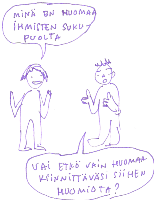
Kuva 1: T-Chat-vertaistutkijaryhmän jäsenen piirros.

Ensimmäinen tavoista on kyseenalaistamaton normatiivisuus, joka ei huomioi mahdollisuutta hetero- tai sukupuolinormien rikkomiseen. Tällaisessa tilanteessa ei yleensä edes huomata normien ja syrjivien rakenteiden olemassaoloa. Tilanne voi olla pohjimmiltaan hyvää tarkoittava, ja tarkoituksena voi olla kaikkien nuorten kohteleva samalla tavalla esimerkiksi sukupuolesta riippumatta. Lopputuloksena voi olla täydellinen näkymättömyys niille, jotka eivät sovi normeihin. Vallitsevia normeja on helppo olla huomaamatta, jos sopii niihin itse (vrt. Älä olet – Normit nurin! 2013, 25). Tällaisesta asenteesta yksi esimerkki on sukupuolisokeus, jota eräs T-Chat-vertaistutkijaryhmässä mukana ollut kuvasi seuraavasti: