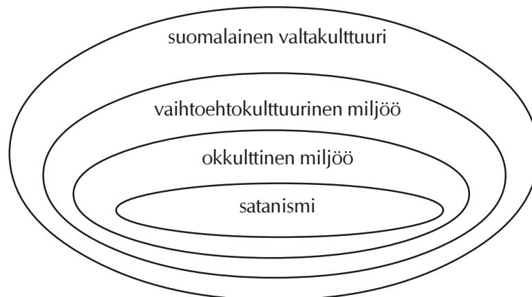
Kuva. 1. Satanismin kulttuurinen sijoittuminen

Jo 1800-luvun lopulla lehtimies Jules Bois kirjoitti Ranskassa ”okkulttisesta miljööstä”, joka sopikin kuvaamaan sen ajan voimakasta okkulttista kiinnostusta. 1970-luvulla Colin Campbell puolestaan kehitti teorian kulttisesta miljööstä, jolle on tyypillistä sen sisällä tapahtuva liike. Campbell ajatteli kulttisen miljöön koostuvan niistä uskomusjärjestelmistä, jotka pyrkivät erottautumaan valtauskonnoista. Näitä uskomusjärjestelmiä leimaavat hänen mukaansa erityisesti uskonnollinen etsiminen, mystisismi, henkilökohtaisen elämän henkistäminen, henkilökohtaiseen totuuteen tai valaistumiseen pyrkiminen ja synkretismi (Campbell 1972, 119–123). Tässä miljöössä oman vaihtoehtoisen elämäntavan etsiminen on olennaista.