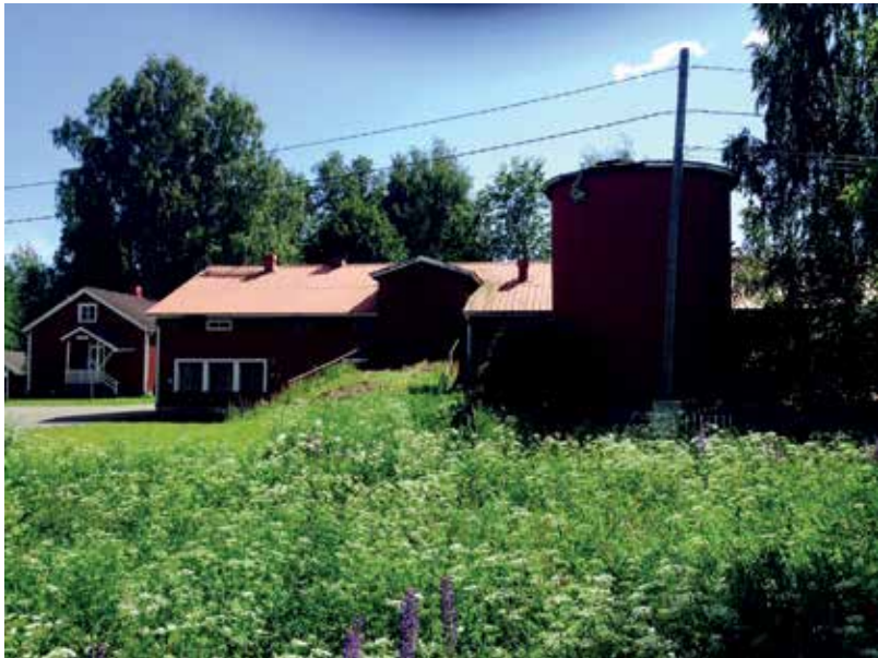
KUVA 6. Hylkysyrjän entinen maatalousoppilaitos, nykyinen turvapaikanhakijoiden vastaanottokeskus (Terhi Halonen)

heikensi oppilaitoksen taloutta. Koulun toiminta kärsi oppilaiden ja työvoiman puutteesta, ja liikekannallepano työllisti oppilaita: syyskurssilaiset leipoivat viikoittain armeijalle tuhat leipää. Kun opetus oli keskeytyksissä, useimmat nuorista naisoppilaita olivat lottatyössä. Sodan syyttyä oppilaitos joutui armeijan majoitustiloiksi ja kenttäsairaalaksi. Karja, vilja, heinät ja perunat joko vietiin pois tai käytettiin paikan päällä. Pommitukset tuhosivat oppilaitoksen rakennuksia. Välirauhan aikana koulu oli käynnissä vuoden 1941 alkupuoliskolla, kunnes sota keskeytti toiminnan. Jatkosota toi Iломantsiin ”pakolaisoppilaita” menetetyiltä alueilta sekä oppilaita miehitetystä Itä-Karjalasta. Edelliset saivat rahoavustusta Karjala-kerhojen Keskusliitolta ja jälkimmäiset Itä-Karjalan sotilashallinnolta. Vuoden 1943 kurssin osallistujat olivatkin suurelta osin kotoisin rajantakaisilta alueilta. ( IMO Vuosikertomus 1939, 1943; IMO Tilanhoitokertomukset 1939–1941; Pukkala 1971, 8–9.)