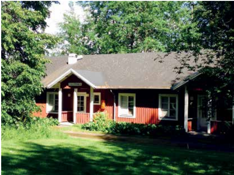
KUVA 8. Entinen Hylkysyrjän oppilasasuntola, nykyinen turvapaikanhakijoiden koti

olevaan oppilaitokseen. Kauemmaksi lähteminen, rohkea hyppy tuntemattomaan, voi onnistua monenkin nuoren kohdalla, monen kohdalla puolestaan päädytään nopeaan mahalaskuun. Kun asiat menevät pieleen ja kun koti on kaukana, nuorten pelastustalkoisiin on haastettava lisää heitä tukevaa ja ohjaavaa ammatti-ihmistöä. Peavylle (2006) nuorten ohjaus on ohjattavan unelmien kannattelua, jonka tavoitteena on ohjattavan vapauden lisääminen ohjaajan antaman tuen avulla. Voiko tämä kuitenkaan toteutua kaikkien kohdalla ja erityisesti Hylkysyrjän niukoissa mahdollisuusrakenteissa?