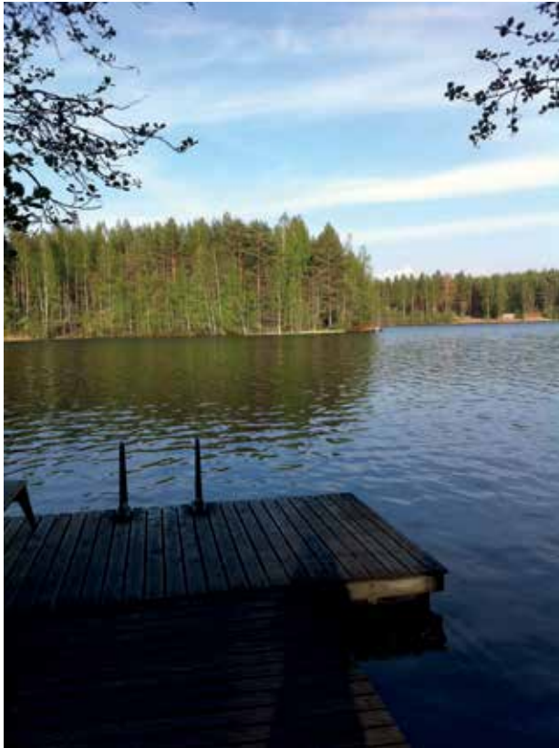
KUVA 5. Mökkiasutuksen reunustama metsälampi Pohjois-Karjalassa (Päivi Armila)

mahdollisuuksia on pyritty hakkaamaan yhteiskuntapolitiikan peruskiveen. Se, miten näissä prosesseissa on kyetty ottamaan huomioon tai haluttu ottaa huomioon erilaisissa ”kilometriolosuhteissa” elävät ihmiset, on pohtimisen arvoinen asia. Miten asiaa on kulloisessakin yhteiskunnallisten uudistusten vaiheessa puitu ja puntaroitu mahdollisuuksien tasarvoa ja yhdenvertaisuuden politiikkaa lupaavassa yhteiskunnassamme?