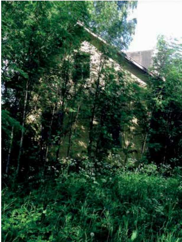
KUVA 1. Kylmä tila – tyhjentynyt kotipesä (Terhi Halonen)