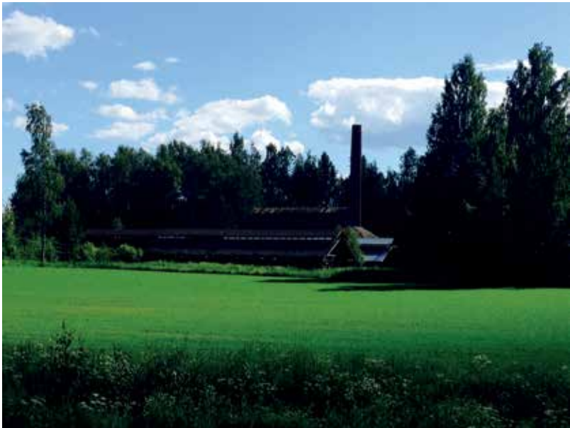
KUVA 4. Tyhjäksi jäänyt Hylkysyrjän tilitehdas (Terhi Halonen)