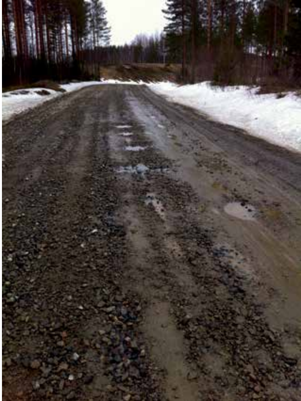
KUVA 2. Kylänraitti (Päivi Armila)