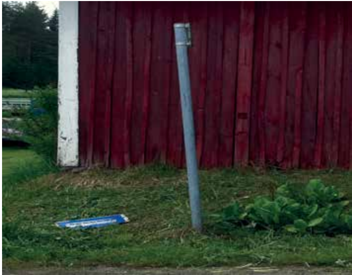
KUVA 7. Joskus tästä kulki linja-auto (Päivi Armila)