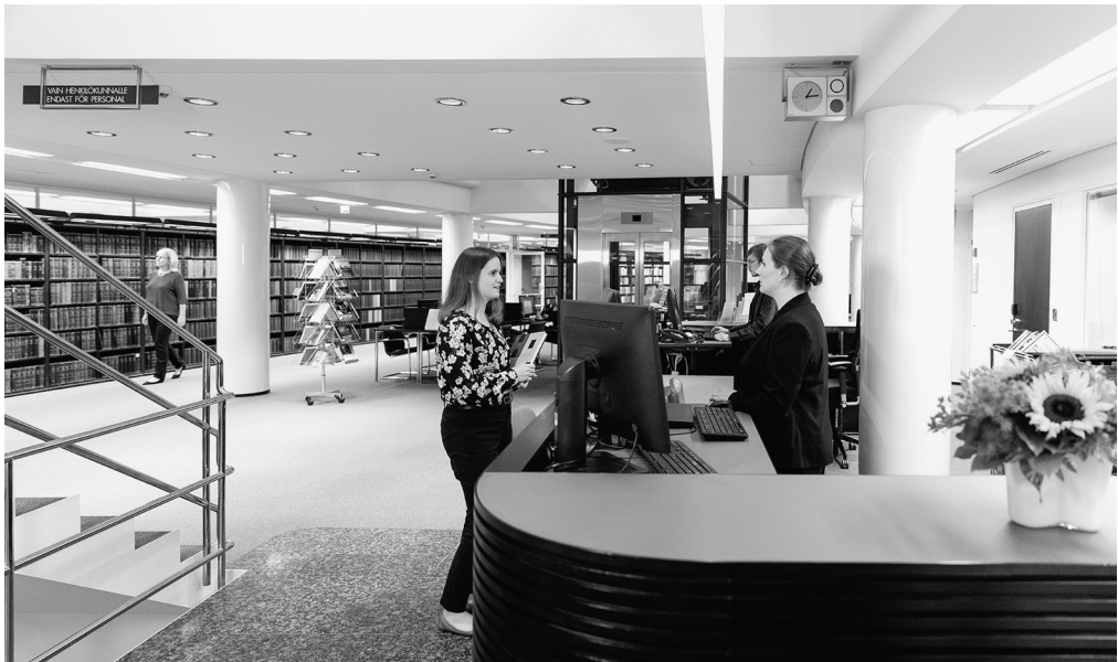
Eduskunnan kirjaston asiakaspalvelukerros vuonna 2019.

Artikkelissa esittelen Eduskunnan kirjastoa ja sen oikeudellisia kokoelmia. Artikkelissa valotan myös kirjaston roolia oikeudellisessa bibliografiatyössä ja oikeushistorian ja kulttuurin vaalijana. Artikkelin lopussa esitän joitakin huomioita digitalisaation vaikutuksista kirjaston toimintaan.