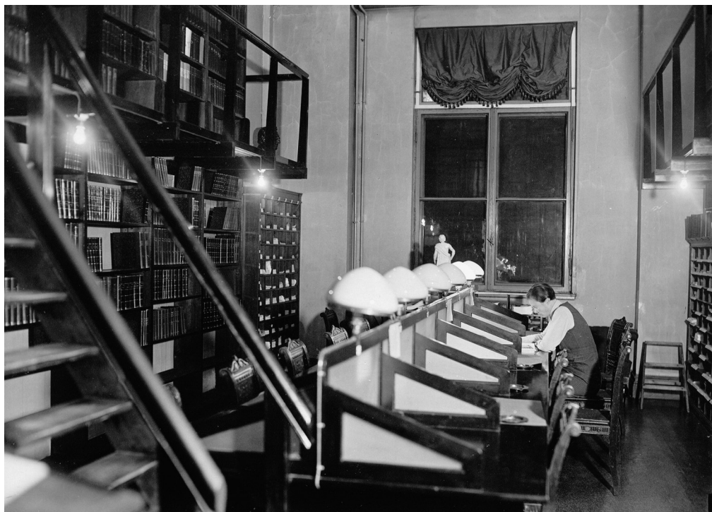
Eduskunnan kirjaston tilat Säätytalossa.

eduskunnan alainen erillislaitos Eduskunnan kirjasto liitettiin vuonna 2000 osaksi eduskunnan kansliaa ja sen tieto- ja viestintäosastoa. Eduskunnan kanslian toimintaa ohjaavien säädösten lisäksi Eduskunnan kirjaston toimintaa säätelee laki Eduskunnan kirjastosta (4.8.2000/717) ja Eduskunnan kirjaston ohjesääntö (20.6.2000/724). Eduskunnan arkisto on osa Eduskunnan kirjastoa. Kirjastolla on kansanedustajista ja asiantuntijajäsenistä koostuva hallitus, joka käsittelee kaikki kirjaston toiminnan kannalta keskeisimmät asiat ja antaa vuosittain eduskunnalle kertomuksen kirjaston toiminnasta. Eduskunnan kirjaston hallituksen asiantuntijajäsenistä yksi jäsen edustaa oikeustieteellistä tutkimusta.