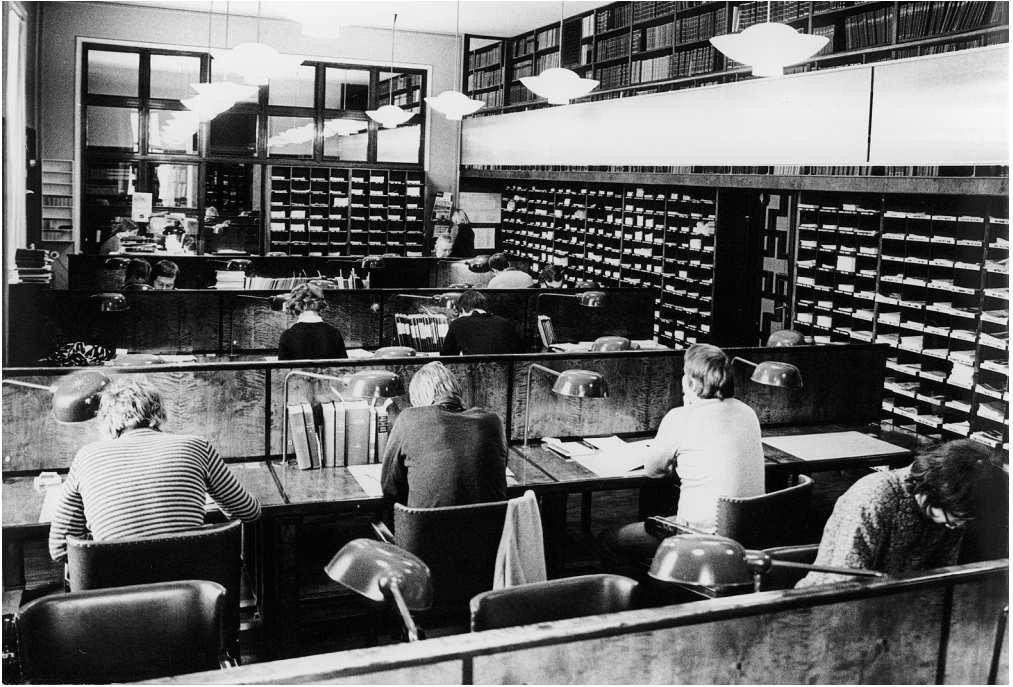
Asiakkaita kirjaston lukusalissa Eduskuntatalossa 1970-luvulla.