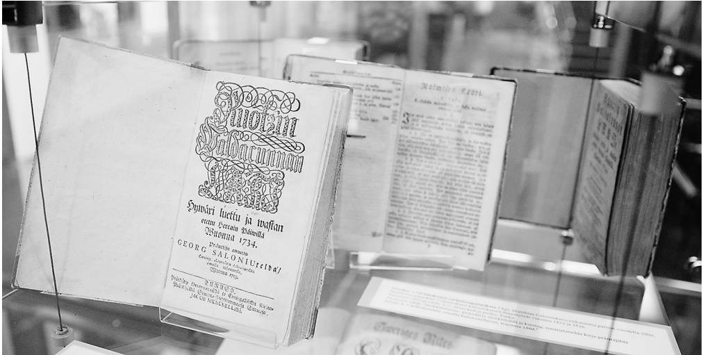
Vanhoja lakikirjoja Eduskunnan kirjaston näyttelyvitriinissä.

Schaumanin vuonna 1924 ilmestyneen Valtiomuotolaistelu Suomessa 1918 teoskappale, jonka tekee erikoiseksi sen lukija, Urho Kekkonen. Kekkonen on ilmeisesti lukenut kirjan erittäin tarkkaan, sillä kirjan marginaaleista löytyy useita Kekkonen tekemiä kommentteja ja muistiinpanoja. 25