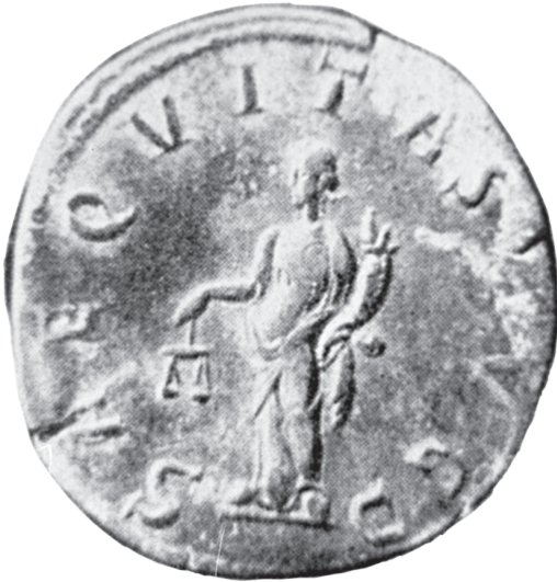
Kuva 1. Sestertius. Takas. Aequitas runsaudensarvi ja vaaka kädessään. Aequitas Avg Sc. Läpimitta 30 mm. Teoksesta Guido Kisch, Recht und Gerechtigkeit in der Medaillenkunst. Heidelberg 1955 s. 134, 171, Tafel I. N:o 4.