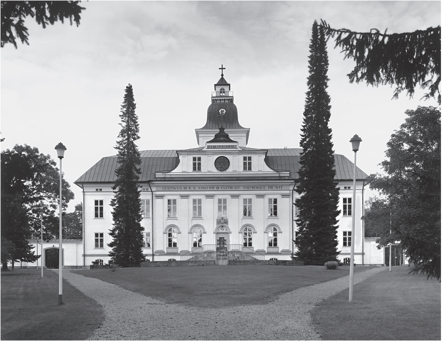
Kuva 3. Kustaa III:n Themikselle pyhitetty kuninkaallinen hovioikeus Vanhassa Vaasassa (nyk. Mustasaaren kirkko).