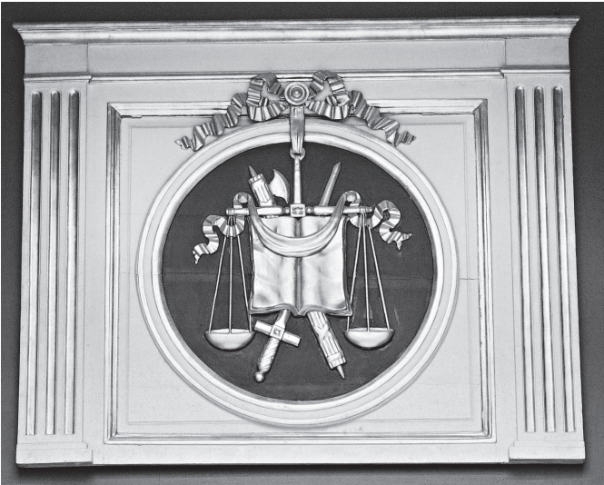
Kuva 4. Tuomarin velvollisuuksista muistuttavat oikeuden tunnukset Vaasan hovioikeuden korkokuvassa (1786). Valokuva Pekka Airaksinen 1987. Vaasan hovioikeuden perinnehuone.