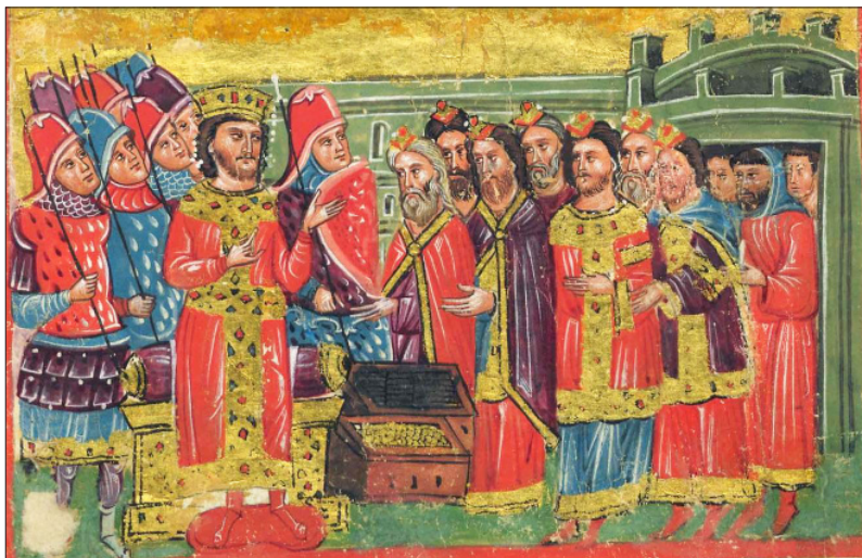
Aleksanteri-romaanin kuvitusta 1300-luvulta; juutalainen papisto tarjoaa bysanttilaisena keisarina kuvatulle Aleksanteri Suurelle kultaa ja hopeaa. San Giorgio dei Greci cod. 5, fol. 92v. Istituto Ellenico di Studi Bizantini e Postbizantini di Venezia. Kuva: Wikimedia Commons. Public domain.

1:5, jonka etiopialaisessa versiossa neito sanoo olevansa ”iholtani musta ja kauniimpi kuin Jerusalemin tyttäret”). 42